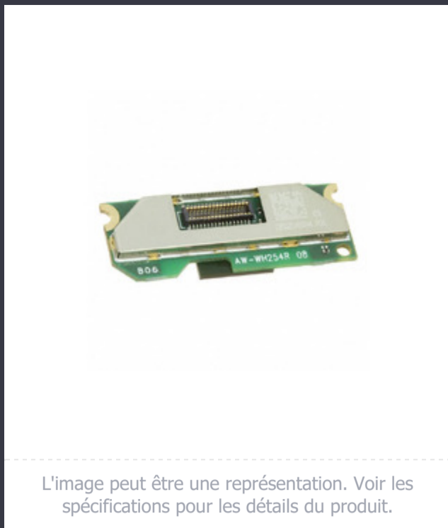
L'image peut être une représentation. Voir les spécifications pour les détails du produit.